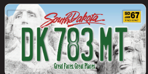
>Dakota du Sud