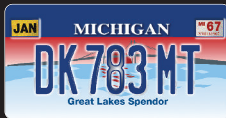
>Michigan Great Lakes