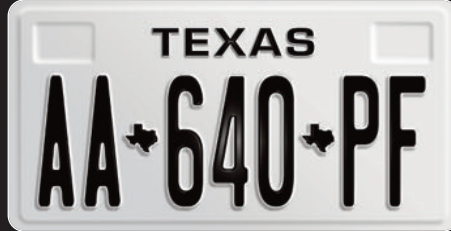
>Texas Black & white