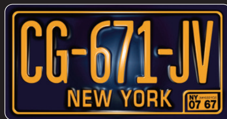
>New York - Métal