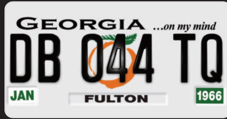
>Georgia... On my mind