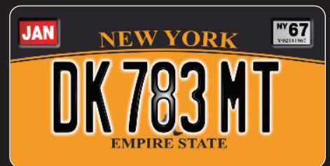
>New York - Yellow cab