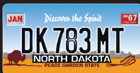
Dakota du Nord