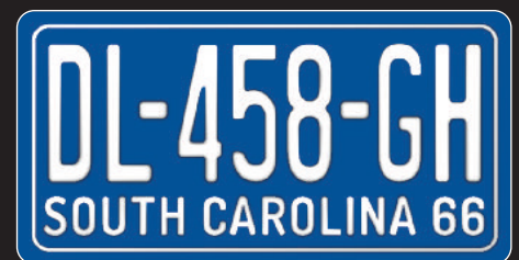
>Caroline du Sud 66